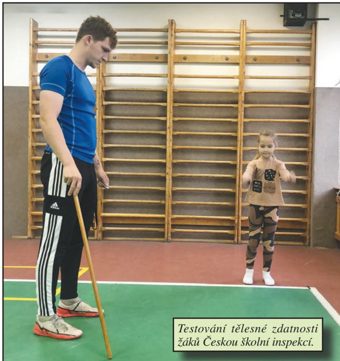
Testování tělesné zdatnosti žáků Českou školní inspekcí.

Žáci se snažili předvést co nejlepší výkony a brzy se dozvíme výsledky v porovnání s ostatními školami celé České republiky. Testování jsme nakonec provedli ve všech třídách na druhém stupni a výsledky vyvěsili na nástěnce u tělocvičny, kde se žáci mezi sebou mohou porovnat. Vojtěch Krajča