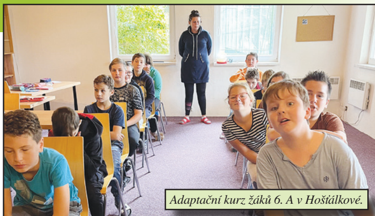
Adaptační kurz žáků 6. A v Hošťálkově.