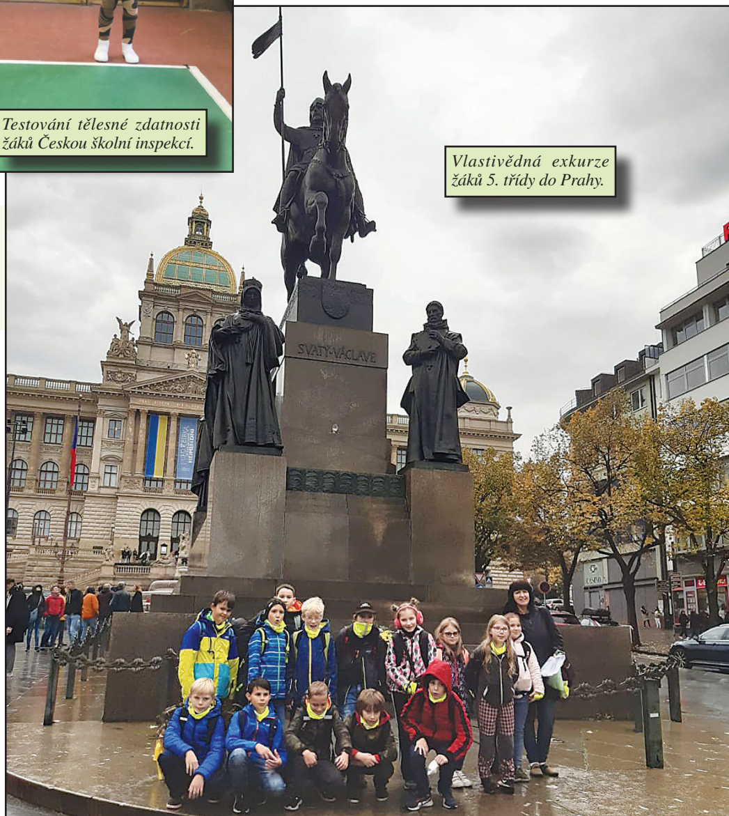
Vlastivědná exkurze žáků 5. třídy do Prahy.