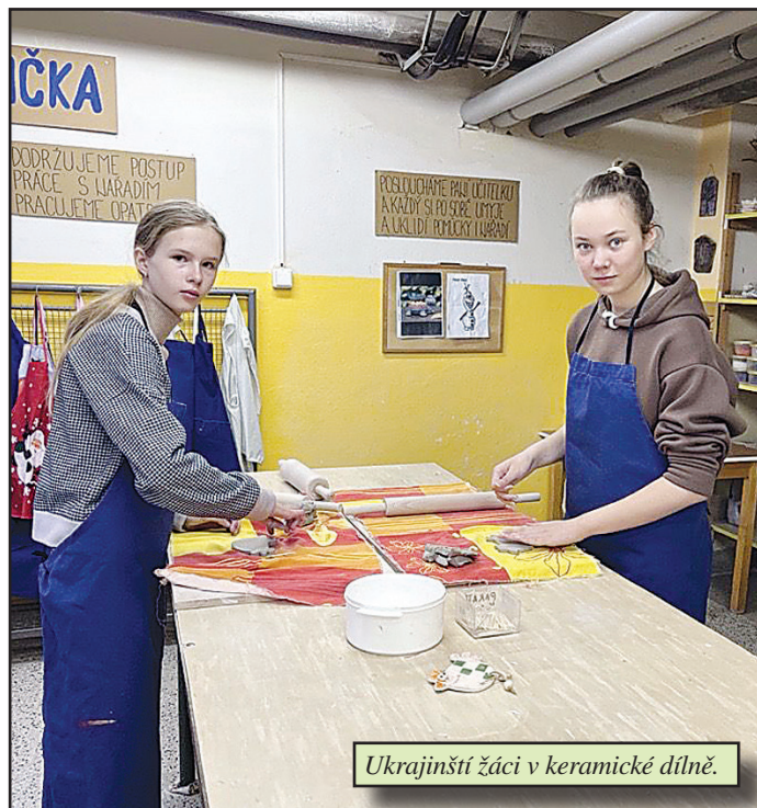
Ukrajinskí žáci v keramické dílně.