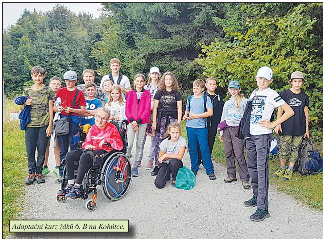
Adaptační kurz žáků 6. B na Kohútce.