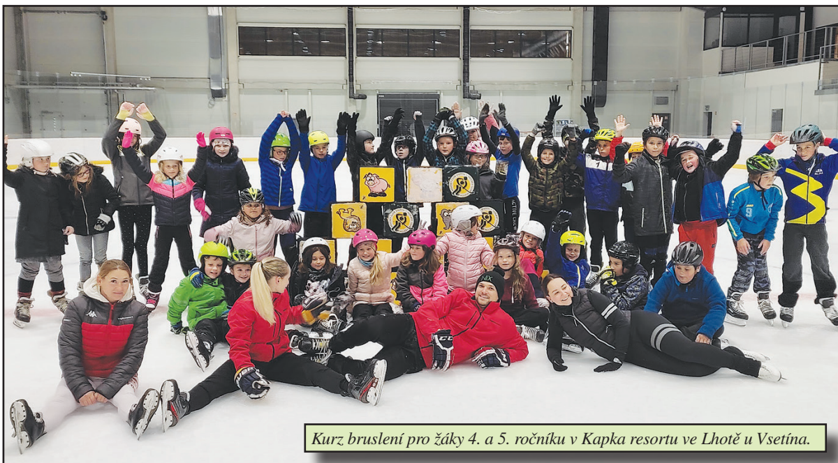
Kurz bruslení pro žáky 4. a 5. ročníku v Kapka resortu ve Lhotě u Vsetína.

Každou středu dopoledne je připraven autobus před školou a odváží děti na stadion. Děti tady mají i možnost zapůjčit si brusle a helmy. Vše už pak záleží na nich, jak zkoordinují své pohyby pod vedením pečlivých a usměvavých trenérů. Plných 60 minut s krátkými přestávkami rejdí a dovádí na ledě. Můžeme zde vidět hru našich babiček Cukr, káva..., hru na babu, zdolávání různých překážek,